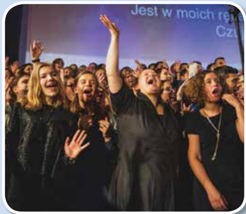
Bed for, at det polske ungdomskor vil vokse og røre flere af Krakows sjæle