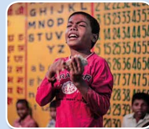
Bed for, at Indiens jernbanebørn skal møde Guds kærlighed