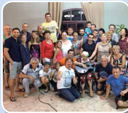
Bed for, at budskabet om Jesus vil sprede sig blandt de russiske stofmisbrugere i Israel