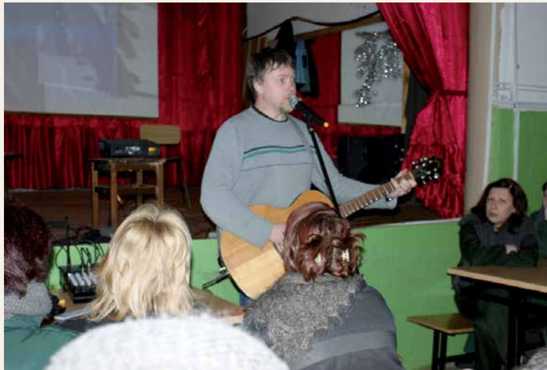
Det kristne russiske band Drusjki holder koncert i kvindefængslet, som ligger udenfor Sankt Peterborg.