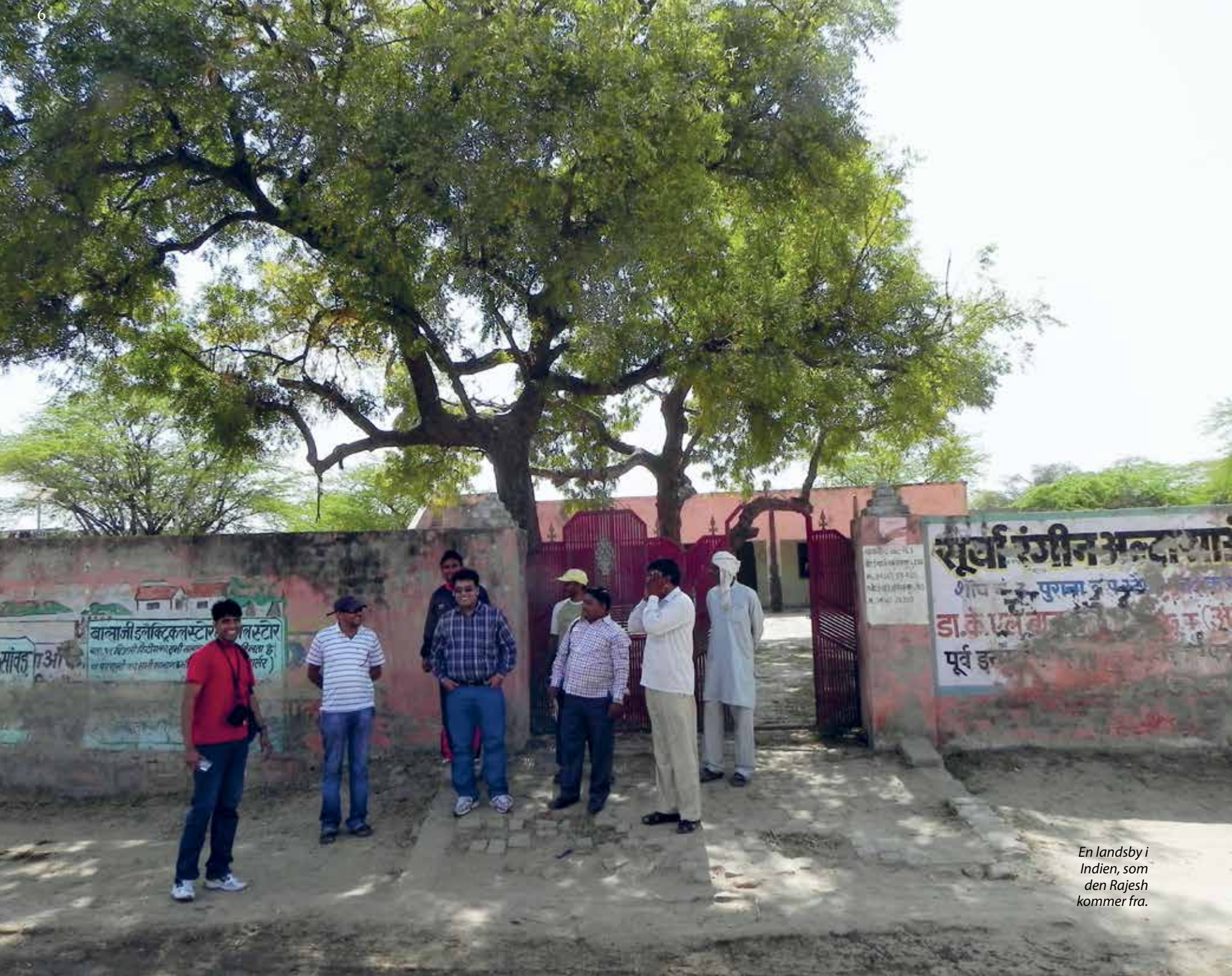
En landsby i Indien, som den Rajesh kommer fra.